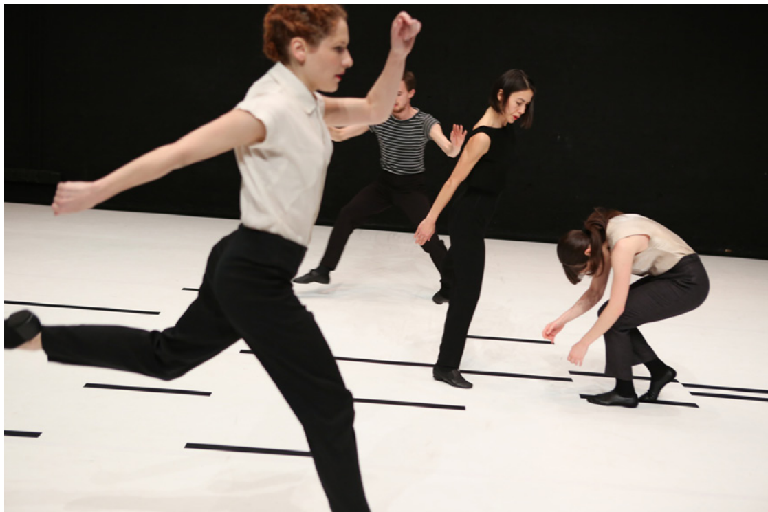
For Claude Shannon

Nous cherchons à comprendre comment le mouvement naît, comment il s'échange, comment nous rentrons dans des états extrêmement particuliers quand nous sommes soumis au regard des autres, et qu'est-ce qui nous meut à partir de cette chose-là. Nous n'essayons pas de donner une forme à des questions scientifiques ou abstraites, mais plutôt de partir de cette question concrète et mystérieuse du corps dans le dispositif de la représentation, et ensuite d'utiliser tous les moyens plus ou moins scientifiques ou intuitifs, pour essayer d'y voir un peu plus clair. Nous cherchons à fabriquer de la complexité, du multiple, à déjouer les forces qui ont tendance à simplifier le réel. Nous cherchons à produire des formes qui demandent au spectateur d'entrer activement dans un dialogue.