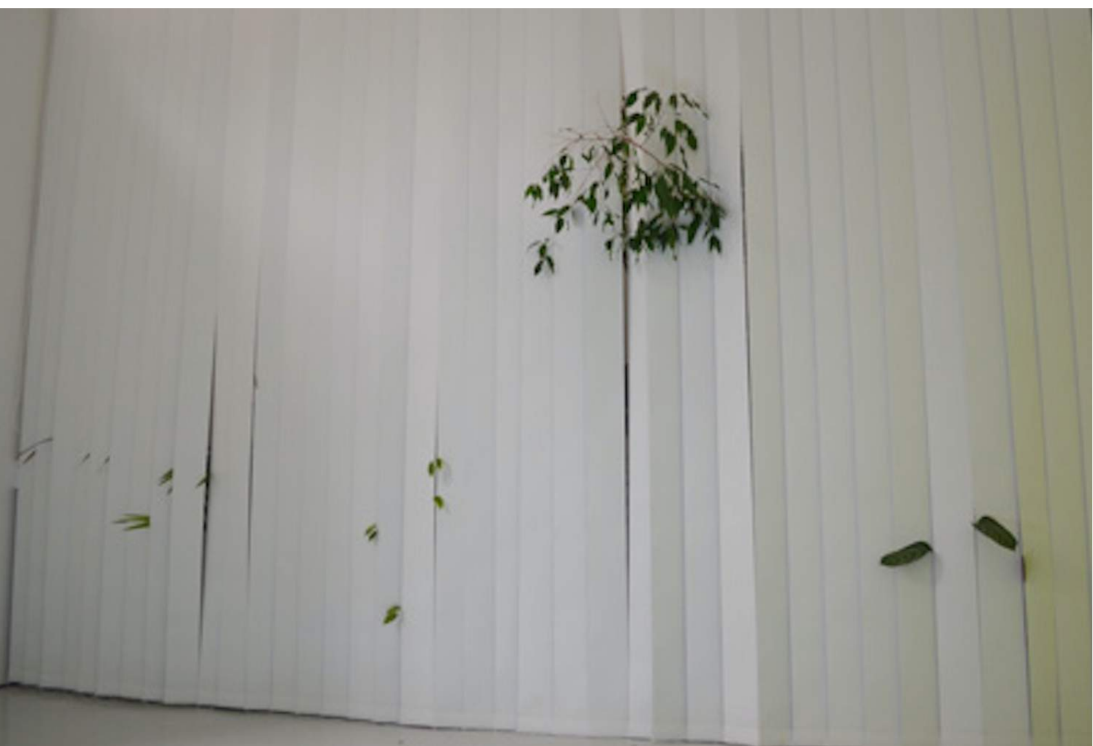
* Célia Gondol